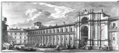
Istituto San Gallicano (IRCCS) - Roma

Struttura Complessa di Medicina Preventiva delle Migrazioni, del Turismo e di Dermatologia Tropicale